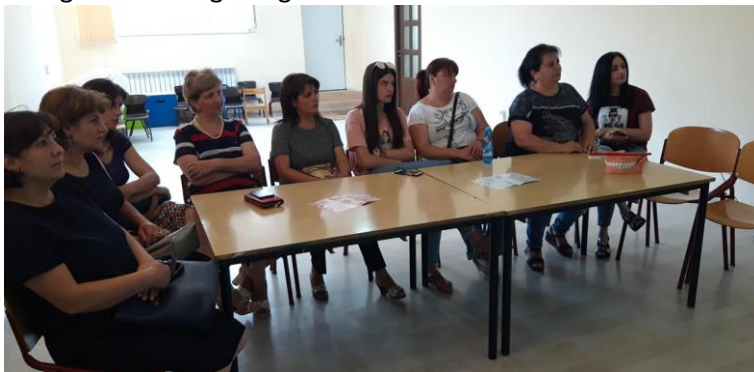
De leerkrachten van de scholen uit de omgeving

Aan het einde van de middag hebben wij een soortgelijke training gedaan met de ouders, waarin bewustwording wederom centraal stond. Ook hebben wij een advies gegeven over mondgezondheidsgedrag voor thuis.