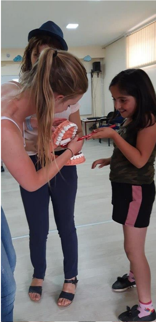
Kinderen deden op het model voor hoe ze moeten poetsen