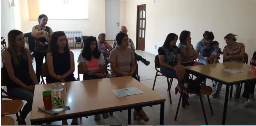
Training aan de ouders vond plaats aan het einde van de middag, de kinderen bleven iets langer op school die dag