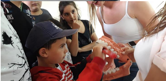
Kinderen deden op het model voor hoe ze moeten poetsen