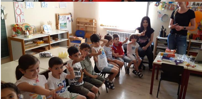
Kinderen van onze eigen groepen geven aan hoe vaak ze moeten poetsen